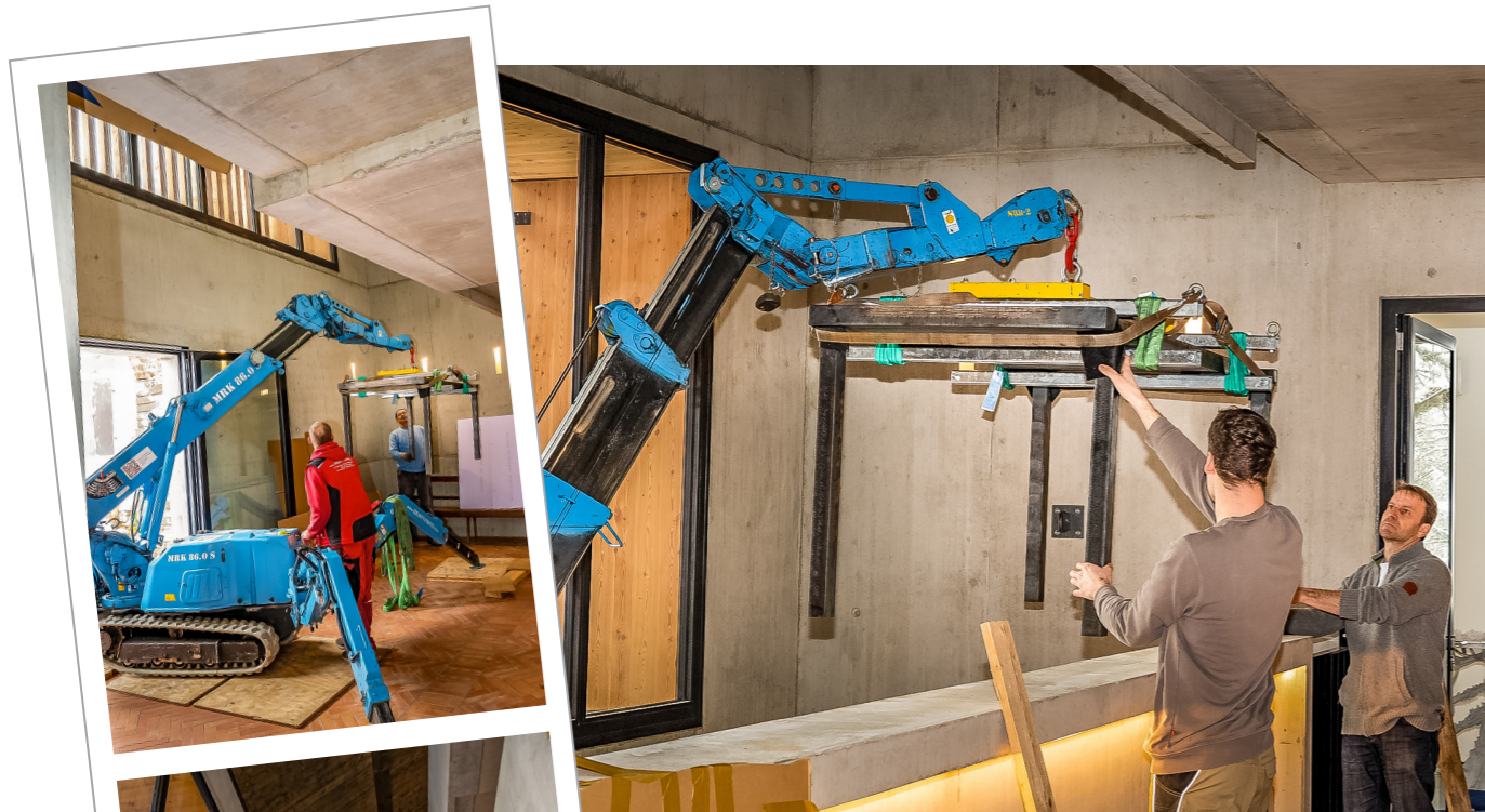
Transport des 1.000 Kilo schweren Stahltisches über die 4,4 Meter hohe Balkonbrüstung. Künstler Rudolf Bott (li., blauer Pullover) begleitet die Arbeiten persönlich