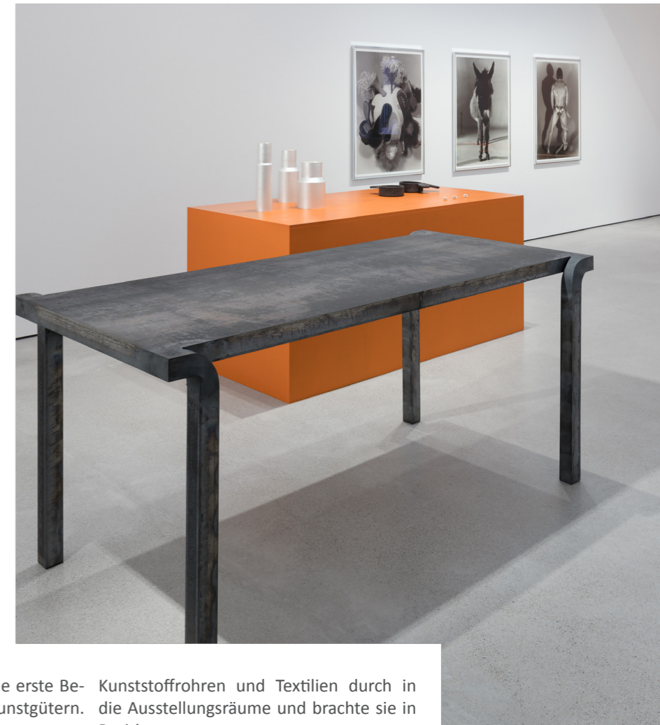
Tisch des Künstlers Rudolf Bott

Die Kunstwerke wurden über eine Traverse an der Montagespitze des Krans befestigt. Ein einziger Bediener steuerte das Transportgut per Funkfernbedienung auf eine Höhe von 5,5 Metern.