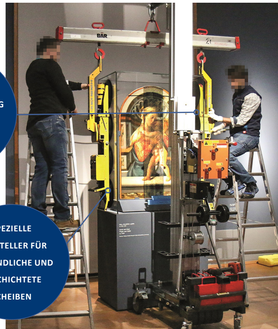
Ausstellung „Florenz und seine Maler“ in der Alten Pinakothek München

SPEZIELLE SAUGTELLER FÜR EMPFINDLICHE UND BESCHICHTETE SCHEIBEN