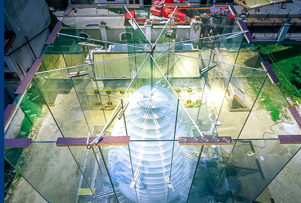
Brâncuși-Pavillon im Craiova Art Museum (Rumänien), Architekt: Dorin Ștefan

Schon viele Ausstellungen konnten weltweit mit Technik und Know how unseres Teams erfolgreich an den Start gehen.