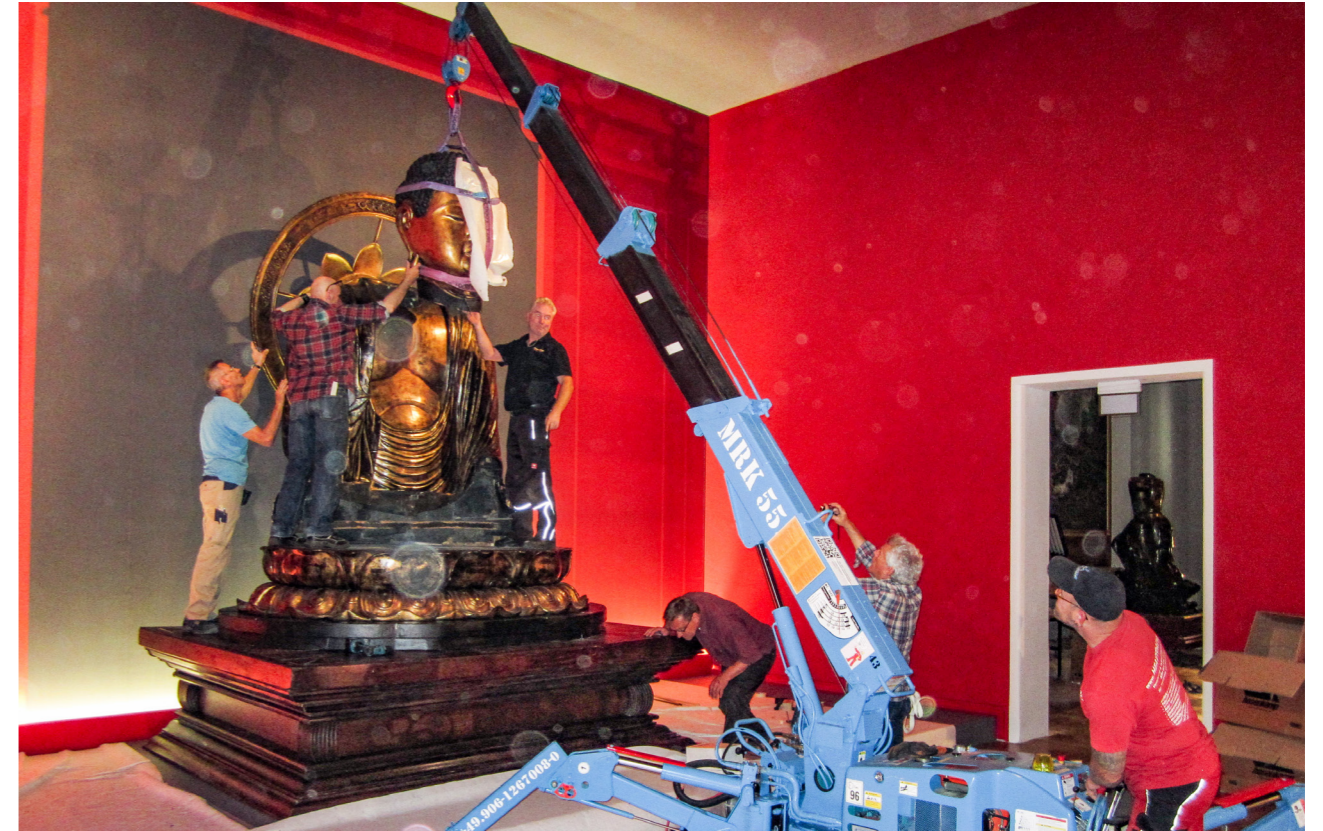
Versetzen einer Buddha-Statue im Völkerkundemuseum in .....