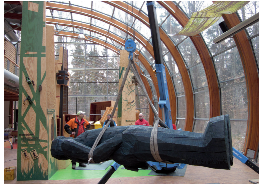
Transport zur Ausstellung ??????????????????

Zudem laufen die Montage- und Transporthelfer per Elektro-Antrieb und damit emissionsfrei.